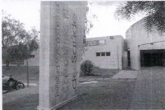
Registro de Localização.